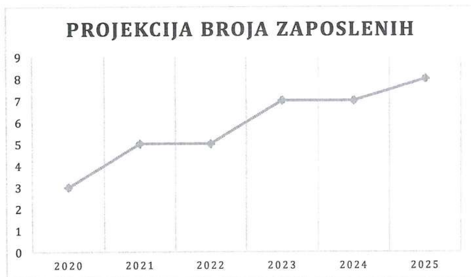
Grafički prikaz: Plan kretanja broja zaposlenih po godinama

Planirano kretanje broja zaposlenih prikazano je grafičkim prikazom u nastavku, a odnosi se na period od 2020. g. - 2025. g. Grafički prikaz prikazuje povećanje broja zaposlenih u odnosu na prethodne godine (prosječan broj zaposlenih) što je rezultat restrukturiranja tvrtke i povećanja prodaje do kojeg je došlo kroz projekciju budućeg poslovanja tvrtke.